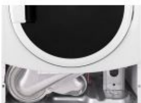
Alsó szerelő nyílás