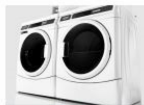
Összeillik a mosógéppel