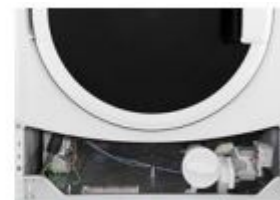
ELŐLSŐ HOZZÁFÉRÉSI PANEJ