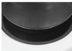
ÚJRA TERVEZETT BORDÁZAT